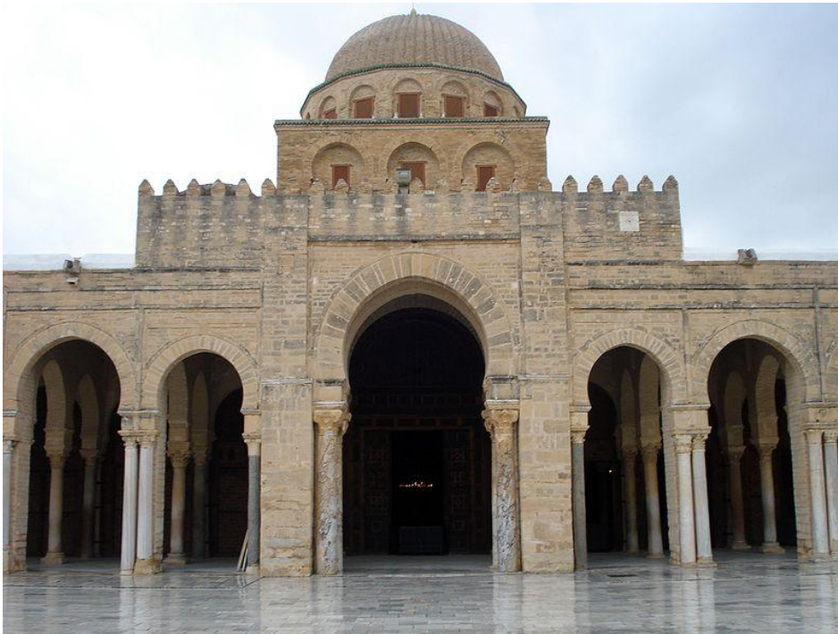
La grande mosquée de Kairouan