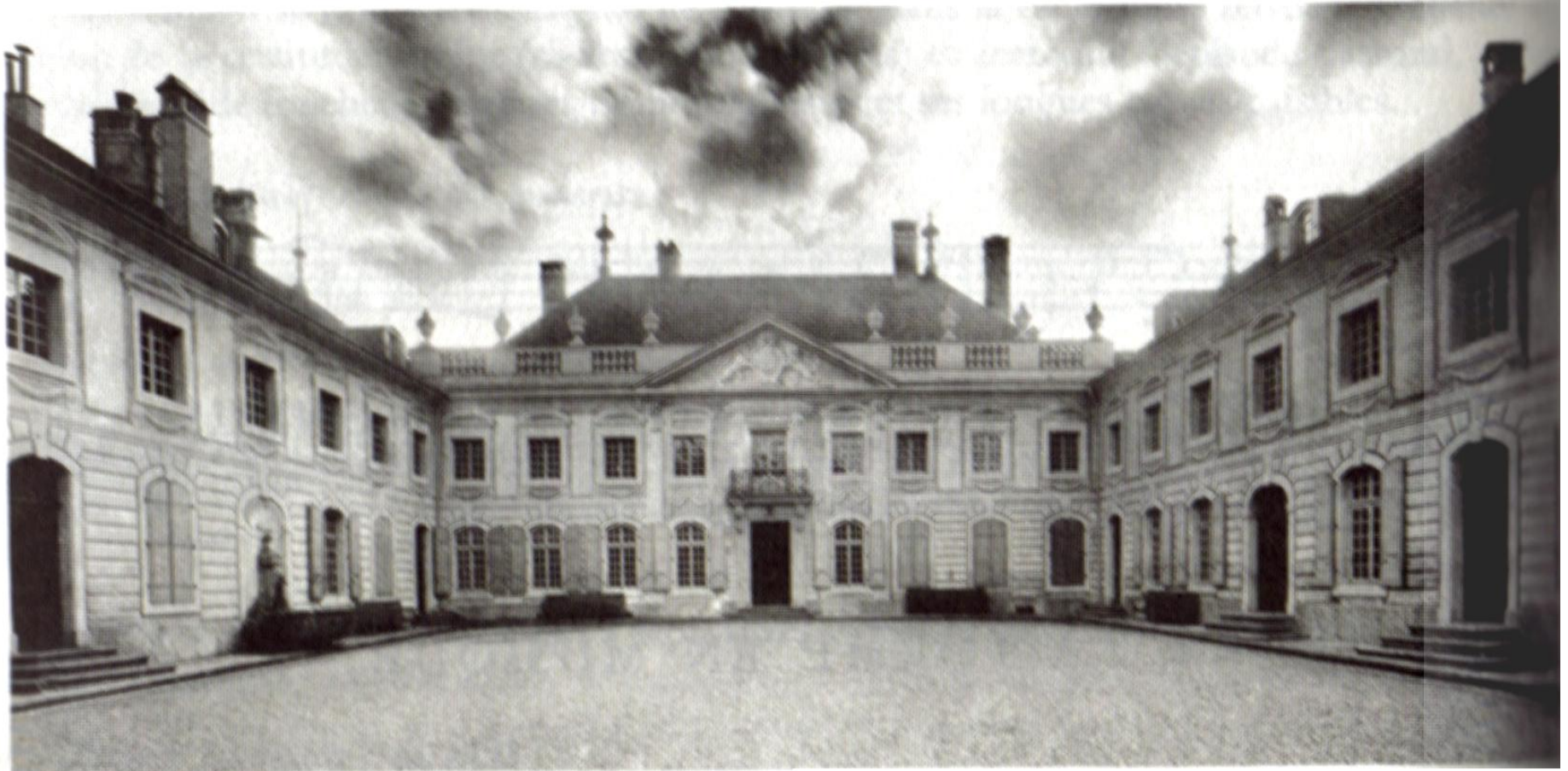
Cour d'honneur du château de Hauteville sur Vevey